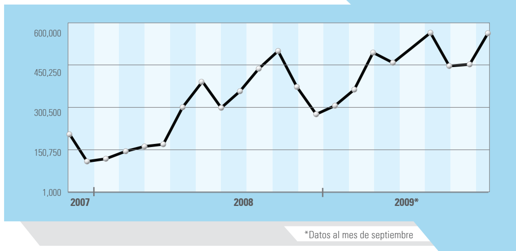
▲ ▲ Visitas mensuales // 2007 - 2009

Estos resultados fueron presentados en abril de 2009 por el equipo SciELO Argentina en la 5ª Jornada de Bibliotecas de Ciencia y Tecnología, en el marco de la 41ª Reunión Nacional de Bibliotecarios organizada por la Asociación de Bibliotecarios Graduados de la República Argentina.